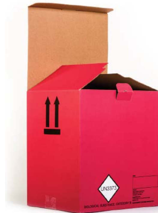
T362 // Colis réfrigéré/à température ambiante de 4,5 kg (10 lb)

AVERTISSEMENT : Tous les colis des laboratoires de Mayo Clinic sont pré-imprimés conformément aux réglementations IATA. Si vous utilisez votre propre emballage, il est de votre responsabilité de suivre les réglementations IATA.