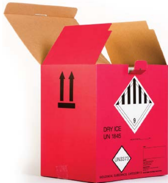
T328 // Colis congelé de 4,5 kg (10 lb)

Déterminez si vos échantillons nécessitent un colis congelé (carboglace) ou un colis réfrigéré/à température ambiante