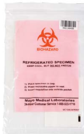
T229 // Sachets réfrigérés (Rose)