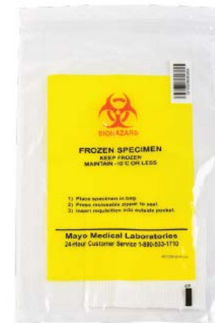
T121 // Sachets congelés (Jaune)